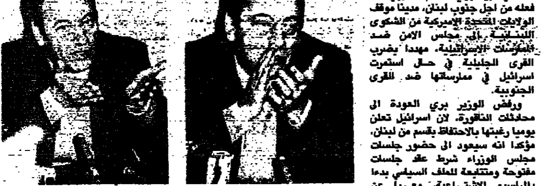
الوزير بري خلال توطئه الصحفية امس

قال امس وزير الموارد المائية والكهربائية والعمل والاصهار والجنوب الخشن نبيه بري العلم العربي عما فعله من اجل جنوب لبنان، مديناً موقفه من الاعتداءات الاسرائيلية، وهدد بضرب قري الجليل في حال استمرار الاعتداءات في الجنوب.